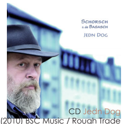
CD Jedn Dog (2010) BSC Music / Rough Trade